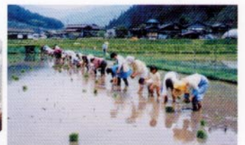
子供も一緒に田植えの体験