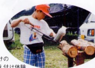
しいたけの菌の植え付け体験

田植え、稲刈り、イモ掘り、りんご狩りなど、家族で参加できるイベントも盛りだくさん。